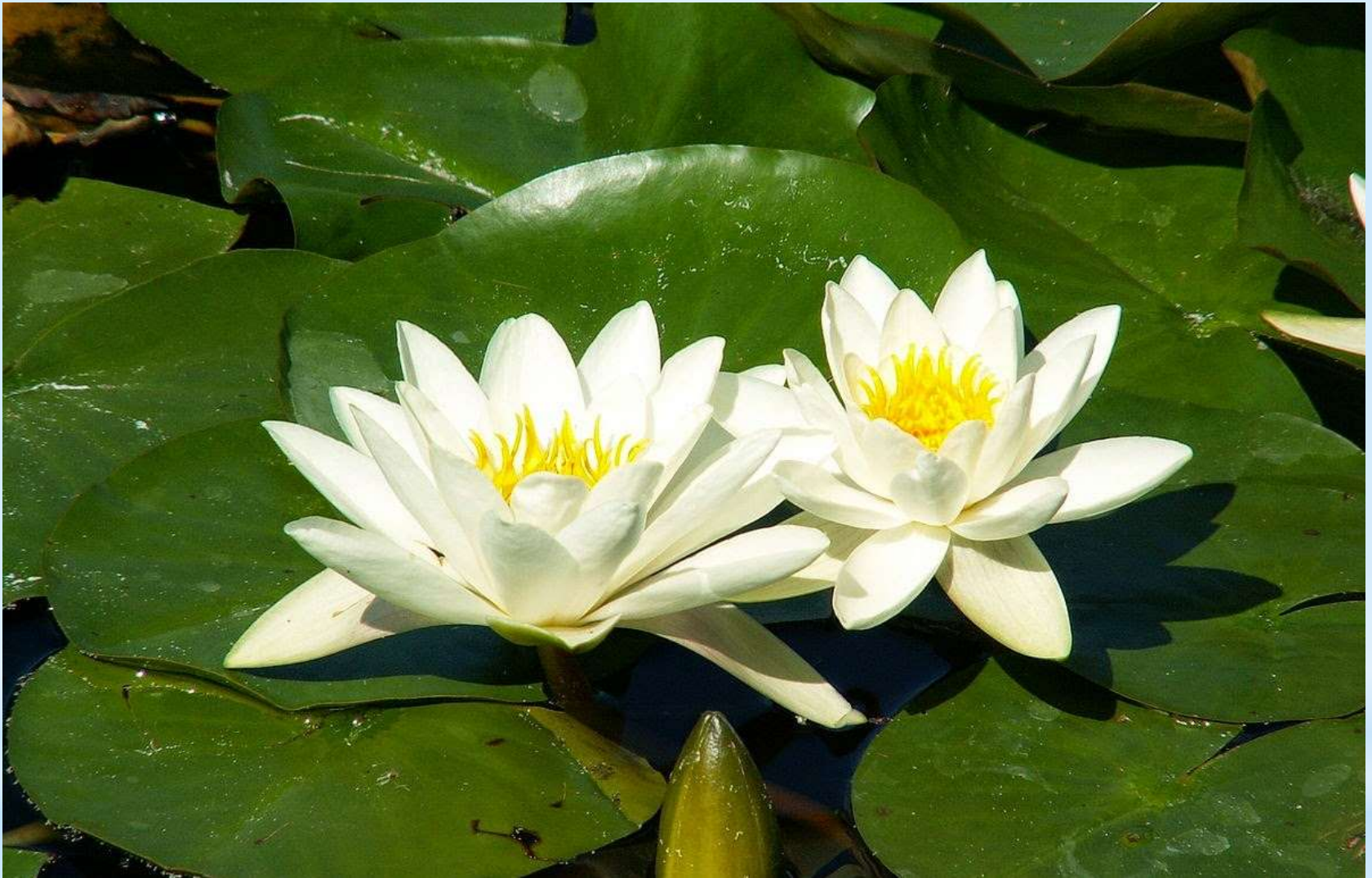
Водяна лілія, або латаття біле